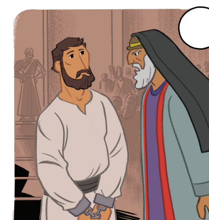
PILATO ENTREGÓ A JESÚS A LA MULTITUD PARA QUE LO CRUCIFICARAN.