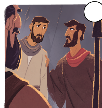
UNA MULTITUD RODEÓ A JESÚS Y LO ARRESTARON.