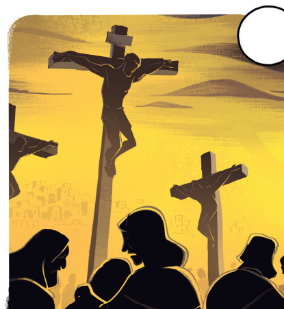
LOS SOLDADOS CLAVARON A JESÚS A LA CRUZ. ÉL MURIÓ AHÍ.

Enumera los sucesos en el orden en que ocurrieron.