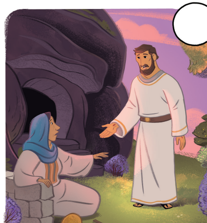
AL TERCER DÍA, JESÚS SE LEVANTÓ DE ENTRE LOS MUERTOS.